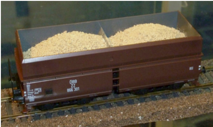
40100: Groberz, frisch gebrochen

Rechtzeitig vor dem 2. Lockdown ist noch ein vollbeladener Erzzug aus Eisenerz bei uns eingetroffen. Somit ist Eisenerz wieder in allen Ausführungen lagernd: