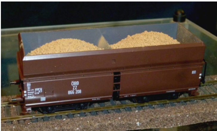
40200: Groberz auf Halde gelagert