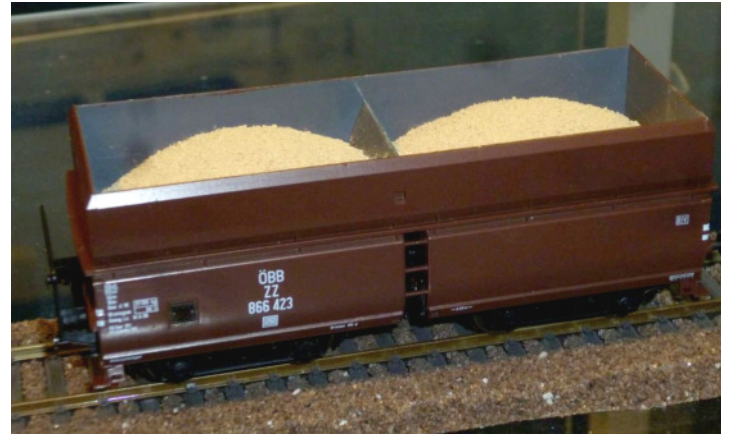
40150: Feinerz frisch gebrochen