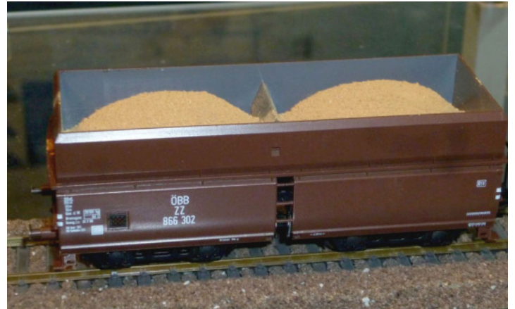
40250: Feinerz auf Halde gelagert

Mehr Informationen über das Erz sind auf der Homepage zu finden: http://www.kj-modell.eu/Eisenerz.html